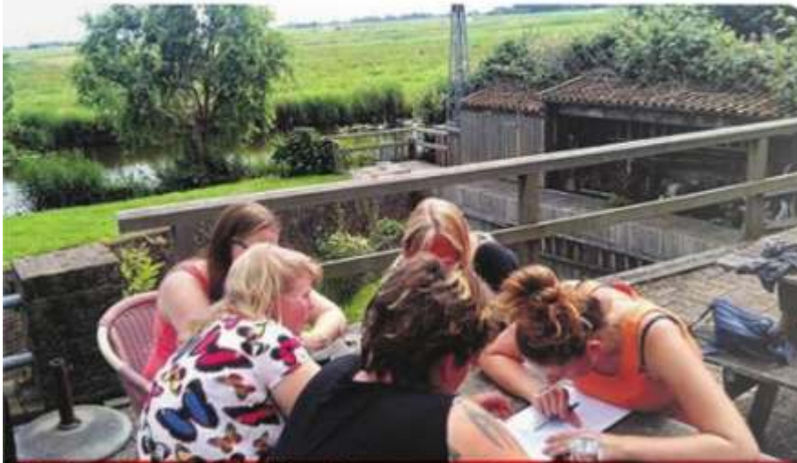
De vrijwilligers lossen een puzzel op.